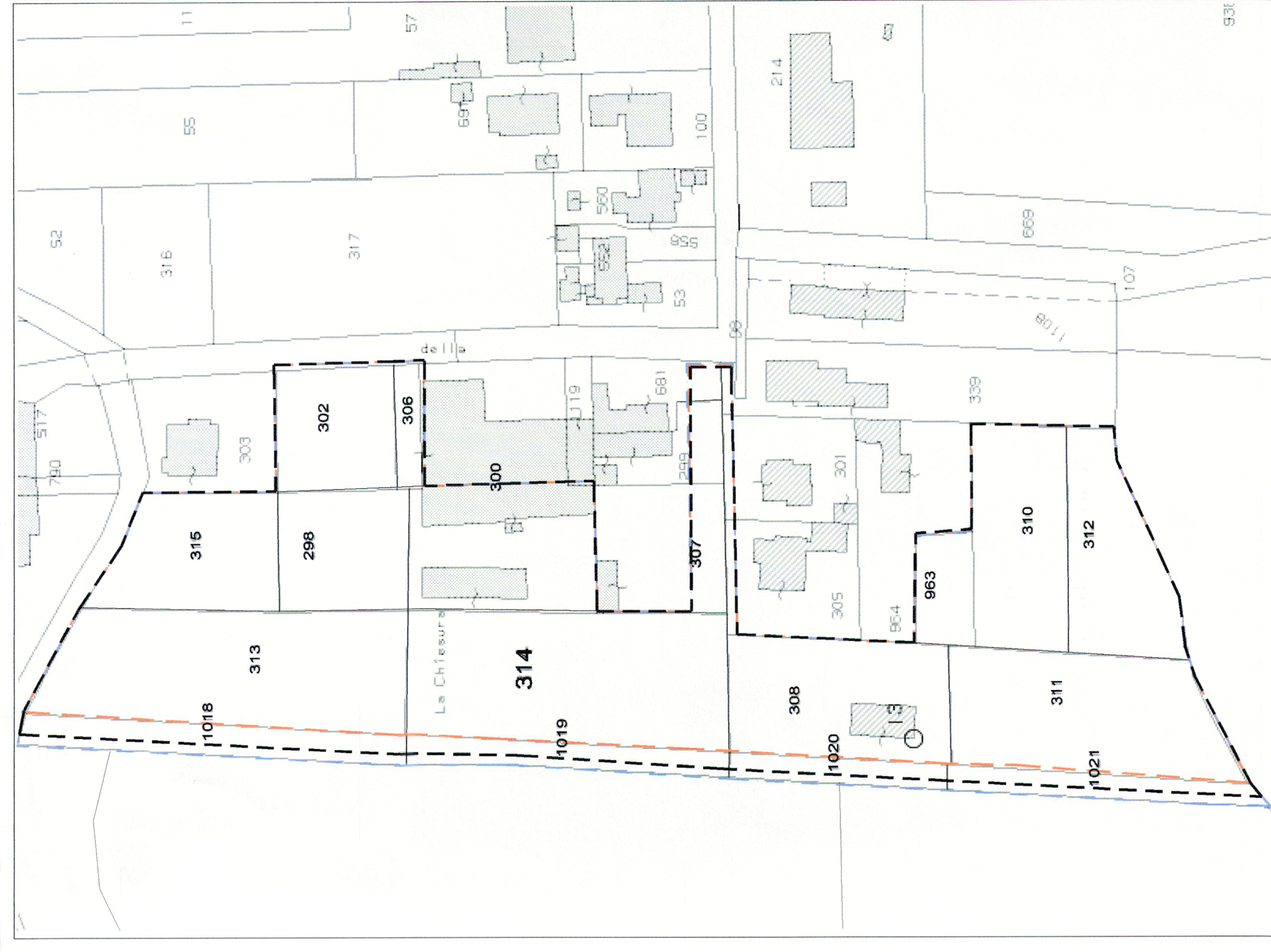
2 INDIVIDUAZIONE PERIMETRI SU ESTRATTO MAPPA